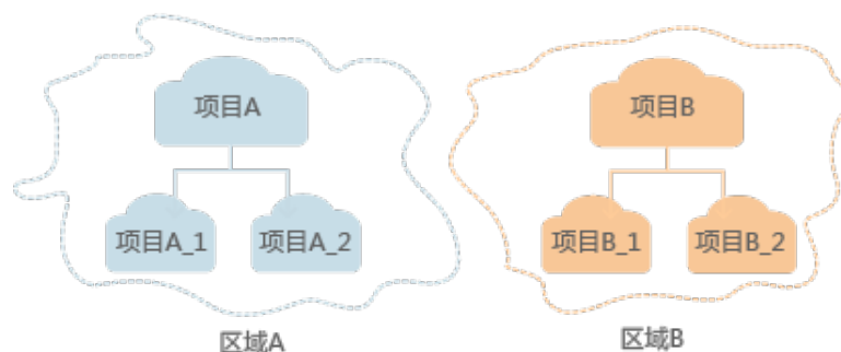
图 1-1 项目隔离模型

区域默认对应一个项目，这个项目由系统预置，用来隔离物理区域间的资源（计算资源、存储资源和网络资源），以默认项目为单位进行授权，用户可以访问您账号中该区域的所有资源。如果您希望进行更加精细的权限控制，可以在区域默认的项目中创建子项目，并在子项目中购买资源，然后以子项目为单位进行授权，使得用户仅能访问特定子项目中资源，使得资源的权限控制更加精确。